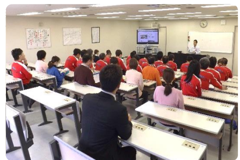
小早氏の講和のようす

続いて、各班のこれまでの成果と問題点を発表しました。それぞれエリアが違いますが、成果も問題点も異なるのですが、そのチームで問題解決しているのが目的のひとつでもあり、これが他のチームにおいても刺激になるのです。この後、各チームに分かれ問題点と計画を立てました。