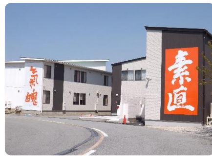
レゾナンス(右)に掲げられた「素直」

直』の文字は、寄り添うように建つホーム「コンスタンツェ」に掲げられた『氣魄』の文字と共に、杜のコースで運転練習されているゲストや私たちの目に「どうなの？」と問いかけるように飛び込んできます。