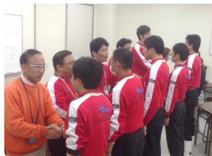
アームハグをして相手をほめる！！

多くの学校・学習塾や企業で紹介してあります。そこに県内の自動車教習所も認定校として紹介され、コーチングが自動車学校にも広がっていることを知りました。更に私たちもゲストが成長できるMランドであり続けるために取り組んでまいります。