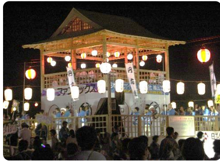
日本最大級の木造やぐら

無数の提灯に彩られた日本最大級の木造やぐらと人々の熱気、聞こえてくるお囃子、篠山の生活感ある歌詞が、ゲストに忘れることのない篠山の思い出となるのでしょう。今年も「日本遺産」のデカンシヨ祭りに、多くのゲストをお誘いするのが楽しみです。