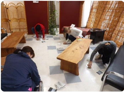
各自の持ち場で黙々と磨きます

「校内掃除に学ぶ会」では館内の掃除が主で、中でも床磨きが人気です。何事も効率的で「菜」という時代に育ったゲストが、ひたすら五十分間床を磨くのです。