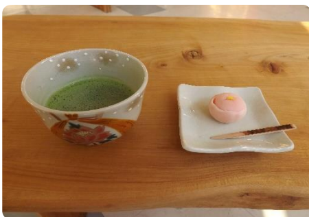
今日はこちらを召し上がっていただきました

Mランドにも床の輝きが広がっていることもお褒めいただき、美味しいくお茶をいただきました。