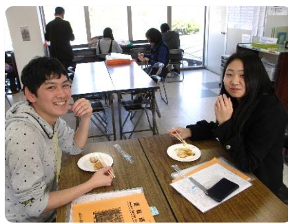
休憩時間に「いただきます！」

つきあがったお餅はきな粉と砂糖醤油に味付けし、教習を終えたゲストやMランドにお越しのお客様にも召し上がっていただきました。