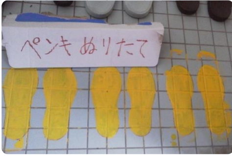
はきものを揃えようという気持ちの表れです

一月十日、トイレの扉を開けますと、入口にスリッパを置く靴型を、児童が床にペイントしていました。