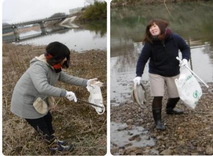
こんな物まで！？(篠山川河川敷にて)

「近隣掃除に学ぶ会」では、気温が下がる日は何気なく捨てられたゴミが道路に凍りつき、はがすのに悪戦苦闘されます。でもそんなゲストは、自分がゴミを捨てるなどということはされないし、自分子どもたちにも、大切なこととして伝えられる親になってくれることでしょ