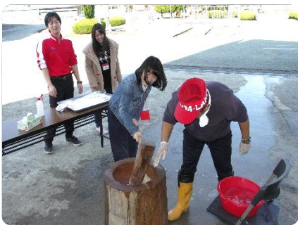
笑い声の中でのお餅つき！

ロビーで勉強されているゲストをお誘いし、蒸し上がったもち米を、今年も交代でついでもらいました。元氣な男子は力づくでつこうとしますが、力だけではつくことはできません。そこでコツを伝授。最小の力で効率よくおもちのはつきあがりです。