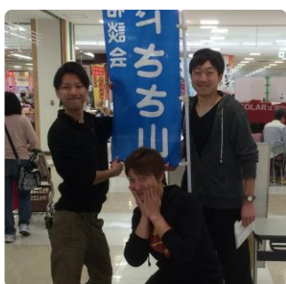
久しぶりに笑顔で

卒業時には「いつてらっしい!」、来所された時は「お帰りなさい!」と言っているのもその表れです。その日、ご友人と共に元気な顔を見せに来てくださいました。