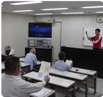
錯覚の絵に目を凝らして

十月九日、篠山市社会福祉協議会の皆さまにお越しいただき、三度目となる研修会を行いました。一人で運転するだけでなく、人を乗せて業務されておられますので、「絶対に事故を起こさない」という意識はどの参加者もお持ちです。