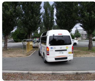
いろいろな所に目配りを！

今回は、「人間の能力」をテーマに認知・判断・操作を関連づけて実施しました。まずは、錯覚と盲点の絵をお見せし、見間違いや見落とし、あるいは背景にまぎれて見るべきものが見えないなど、普段当たり前のようになっている運転中の景色も正しく見ていないことを理解していただきました。このように見方を間違えたと判断も違ってきます。