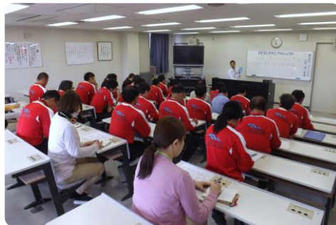
小早氏より掃除の効果についてのお話

Mランドの三種の神器といえば、「あいさつ」、「はがき」、「掃除」で、とりわけ掃除に對しては、毎朝それぞれ自分の持ち場を美しくする意識は持つて取り組んでいるのですが、職員間で温度差があるのも正直なところでした。