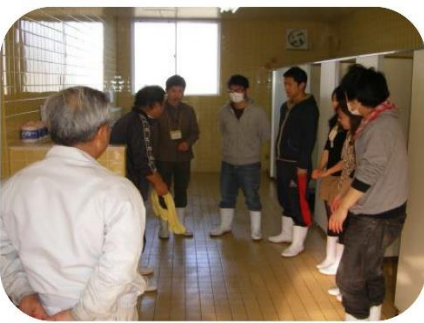
掃除が終わって清々しく！！

学ぶとはまさにこのこと。勉強に、スポーツに、運転にと積み重ねが全てに共通します。参加者の取り組む気持ちと比例してトイレも輝きました。