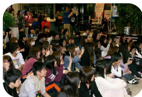
キャラクターの登場に大歓声! 写真を撮るのにみんな必死です。

Mランドには、いつもこ んな雰囲気があり、遠くか ら一人でお越しになられ たゲストもすぐにソウル メイトと仲良く滞在生活 を送られるでしょう。