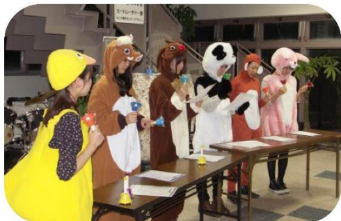
うまく演奏できるかな!?

スタッフのアトラクシ ョンでは、思いもよらない パフォーマンスに会場割 れんばかりの大爆笑! 趣向をこらしたMラン