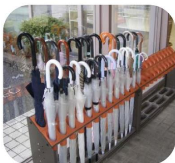
傘をそろえて気持ちもそろろう!

Mランドの傘立ては、左 から高い順に傘を置いて いきます。 そろえると一体感が生 まれ、みだれている時の異 変にすぐ気がつきます。玄 関に入ってこられたお客 様はこんな小さなこだわ りから何かを感じ取って おられるでしょう。