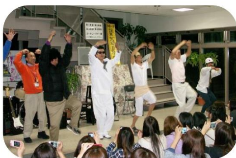
面接が一転、OBKダンスに!!

春休みの期間、Mランド では、ところ狭しと多くの ゲストでにぎわいます。通 学ゲストと共にホーム滞 在生のゲストにもMラン ドの楽しさを知ってもら おうと、職員があの手、こ の手でイベントを企画し ました。