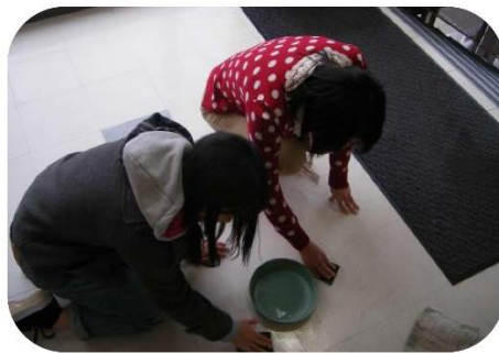
床を磨く手に気持ちが入ります

私たちは日常生活の中で五〇分間、無心になって物事に取り組むことがあるのでしょうか。そんなことをゲストの姿から学ばせていただいております。