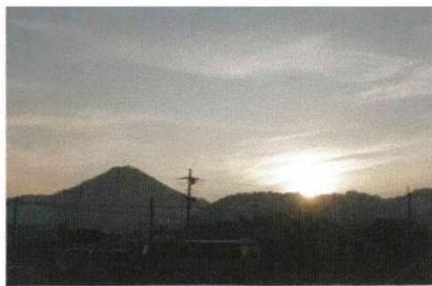
「丹波富士と称される高城山の 優美な姿と日の出」 (教習所前から撮影)

ピーンと張り詰めた清新な空気に柔らかな新しい光がさしてきます。全てを包み込み、そして全てを与えてくれるような朝の光です。