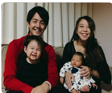
ささ山校、期待の新人です

また、篠山へ新居を移し家族が増えたことで、私に課せられた責任は大きくなり、精一杯それに応えられる人間を目指していきます。