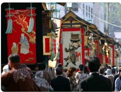
山鉦(篠山市ホームページより)

十月二十日と二十一日の両日は、篠山地方三大祭りのひとつ、春日神社の秋季大祭が開催されます。