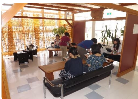
三宝庵に穏やかな時間が流れます

三宝庵の皆様へ 今日は素敵なお茶席の場にお招きいただきありがとうございました。 栗大福も島根の抹茶も大変美味しかったです。お茶席に参加するのは初めてでしたが、お茶の作法を教えて頂いたり、一緒した方との会話を楽しんだり、とても充実したひとときとなりました。貴重な体験をさせていただき、ありがとうございました。