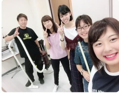
ボランティアも一緒、笑顔の四人組

ボランティアでは自動車を運転する上でドライバーとしての思いやりや気付き、広い視野を持つことの大切さを学ぶことができ、私たちのこれからの活かすことができます。