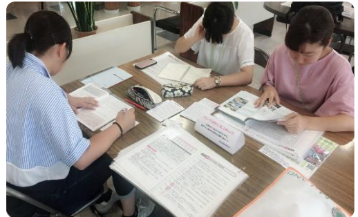
熱心さに声もかけられません

ボランティアでは自動車を運転する上でドライバーとしての思いやりや気付き、広い視野を持つことの大切さを学ぶことができ、私たちのこれからの活かすことができます。