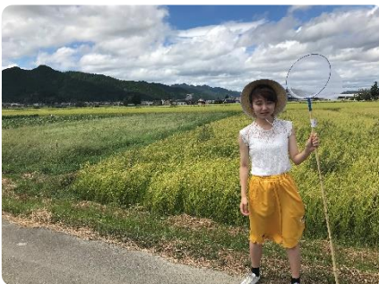
篠山の大自然を満喫されました

赤い帽子に赤いポロシャツ。チャームिंगなインストラクター。とても気さくで関西の「ツツコミ」にはじめて触れ、すぐに打ち解けた。学科や技能の教習の後には、友だちと試験の勉強や息抜きの散歩、花火や虫捕り。免許を取るだけではないことがMランドの魅力だ。