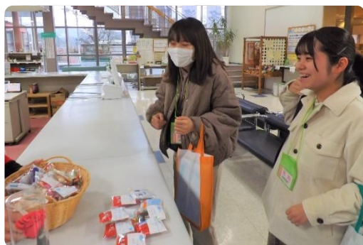
ゲストの笑顔が、私たちの元気の源です

いのに、いいんですか?」「男なのにもらっていいんですか?」「これでテストがんばれます」など、さまざまな喜びの声を聞かせていただきました。