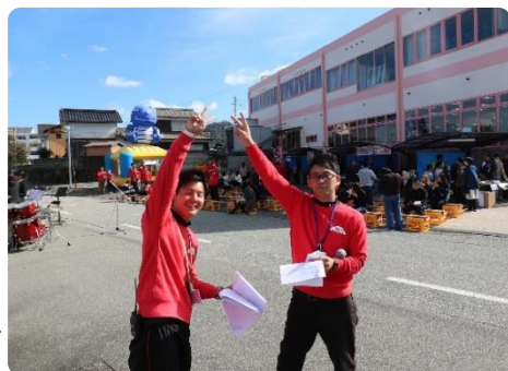
昨年のMランドフェスタで(左)

そんな中、全力で臨んだ初めての指導員審査でしたが、結果は不合格。全力で取り組んでいたからこそ、本当に悔しく、涙を流しそうにもなりましたが、多くの方々に支えられ、二回目の審査で合格することができました。