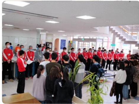
被災地に向け、心をひとつに黙禱

そして、今もなお避難を余儀なくされておられる方々にお見舞いの黙禱を捧げています。