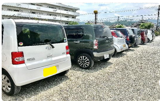
軽自動車チームもバッチリ！

朝の会社から美しい環境を目指し、皆で考え行動することにより、一日の始まりを気持ちよく迎えることができます。