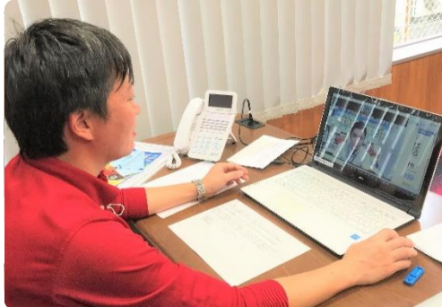
顔の表情や、声のトーンに気をつけて

実際に使用するZoom(オンラインアプリ)を使ってテスト映像や操作方法の確認など、初の試みに不安もありましたが、大学生協様の丁寧なサポートをいただき、大きな混乱もなく実施することができました。