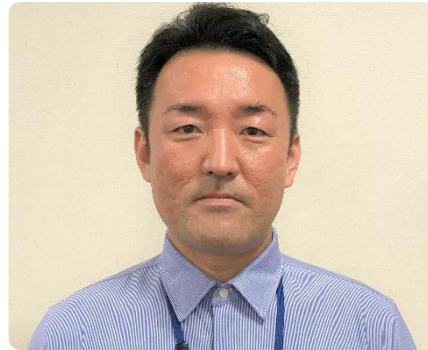
新しいステージで貢献します