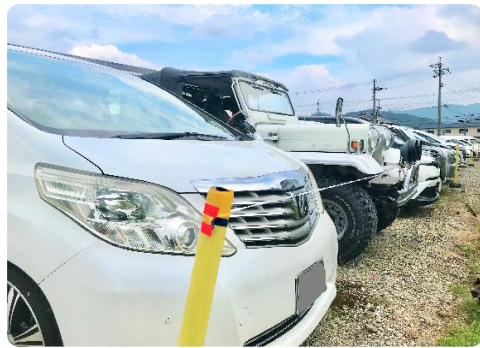
自分が乱れると後に影響します

Mランドニュース七月号では様々な取り組みをご紹介させて頂きましたが、今回はMランドの駐車場をご紹介します。