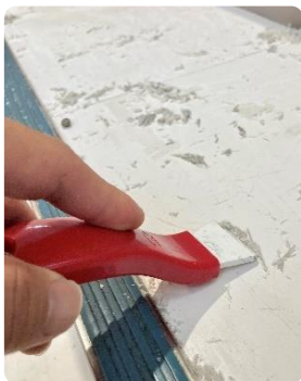
ちから加減、角度を工夫

まず、セラミックスクレパーで床のワックスを落とし、傷や汚れは紙やすりで根気よく磨きます。