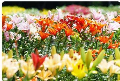
花の彩りに、心が癒されます

園内には約六十種、十萬本のゆりや千本の紫陽花が色鮮やかに咲き誇り、その美しさに見る者はことばをうしないます。