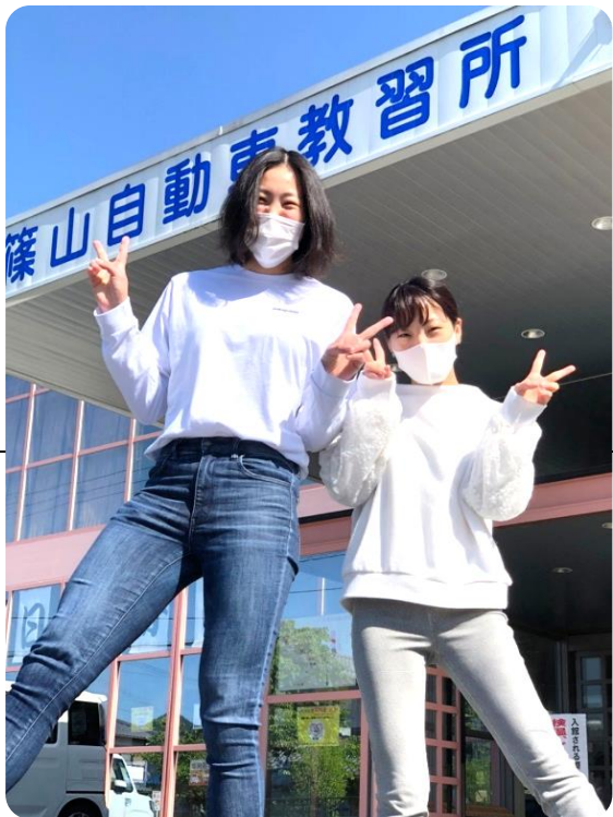
それぞれの道で、大きくはばたいてください!

女子バレーボール選手でも ある石川様は、実業団「東レ アローズ」や、「PFUブルー キャッツ」、更にトルコのチー ムでもプレーされ、現在海外 での活動を目標に、がんばっ ておられます。