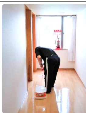
思いは最高の環境へ

私たちは閑散期とは言わず、ゲストのため施設を整えるための「環境月」といいます。気持ちよく滞在し教習を受けていただくため、日頃できないホームの整備もそのひとつです。