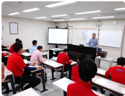
一人ひとり、思いを述べました

これまで創立記念日には、さまざまなイベントや行事を行なってきましたが、今年が会社の「理念」のこぼに込められている意味について、方向性をひとつにしました。