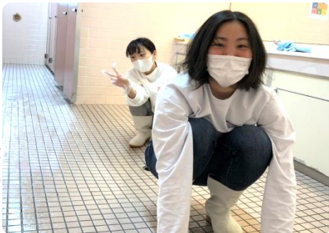
いつもより、目線を低くして

・普段の目線と低い姿勢とで は、こうも見え方、感じ方 が変わるものかと知った。 ・朝食が楽しみ(笑)。