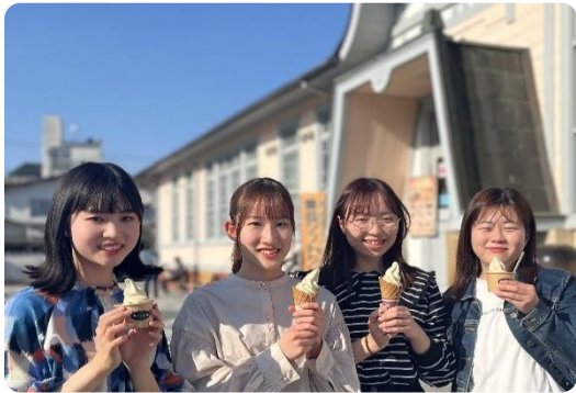
仲良くなった友達と観光名所で記念写真📷

そこで、この季節に合わせてMランド新企画『秋限定合宿プラスワンデー』と題しまして、卒業検定合格後にMランドにもう一泊して、魅力いっぱい秋の丹波篠山を観光できるプランをご用意しました!!